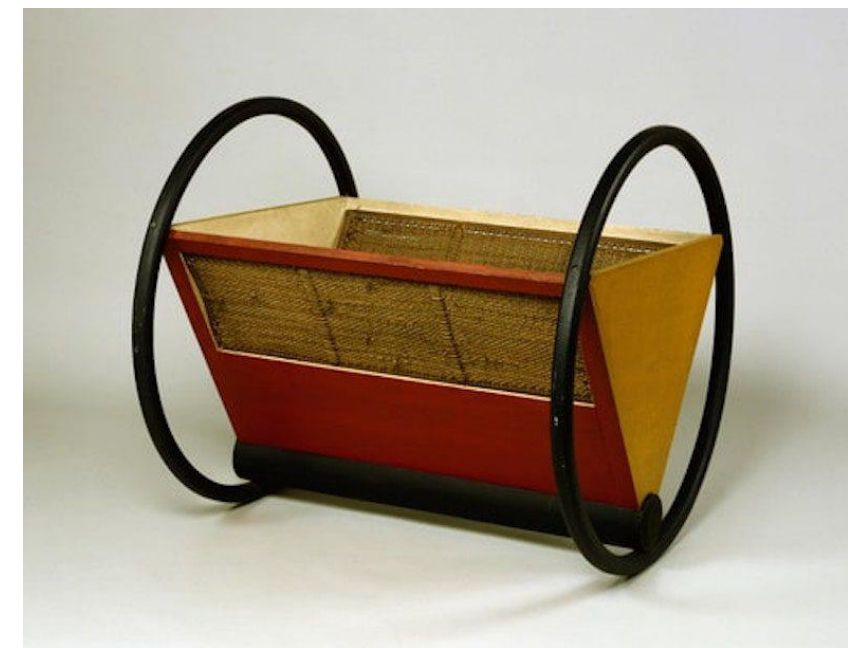
Cuna de Keler. Deseño de Peter Keler, 1.922.

2.2. Partindo da análise e comentario crítico anterior, faga unha proposta de deseño para unha cadeira mecedora, para a nai ou o pai, utilizando os mesmos materiais, elementos compositivos e cores. / Partiendo del análisis y comentario crítico anterior, haga una propuesta de diseño para una silla mecedora, para la madre o el padre, utilizando los mismos materiales, elementos compositivos y colores. (7 puntos: bosquejos/bocetos 2, proposta/propuesta final 3, presentación 2)