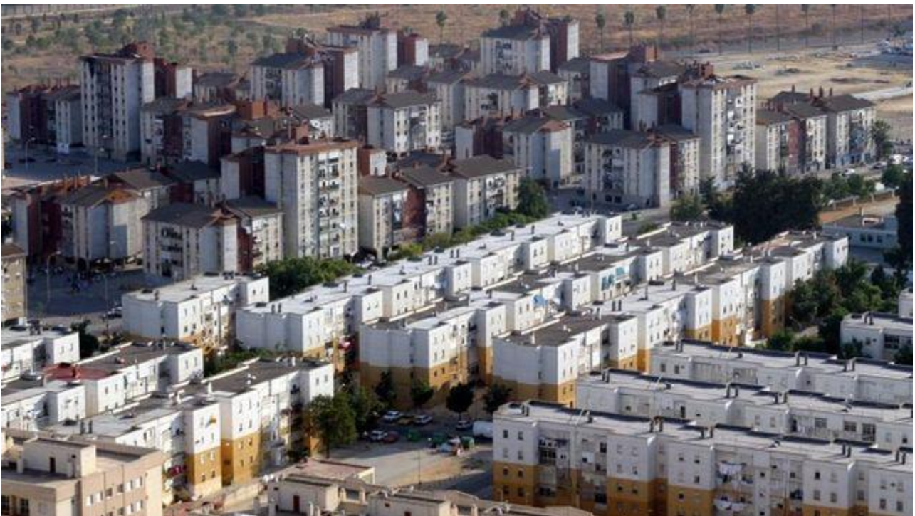
Figura 1. As Tres Mil Viviendas (Sevilla).

PREGUNTA 3. Análise de documento gráfico / Análisis de documento gráfico: