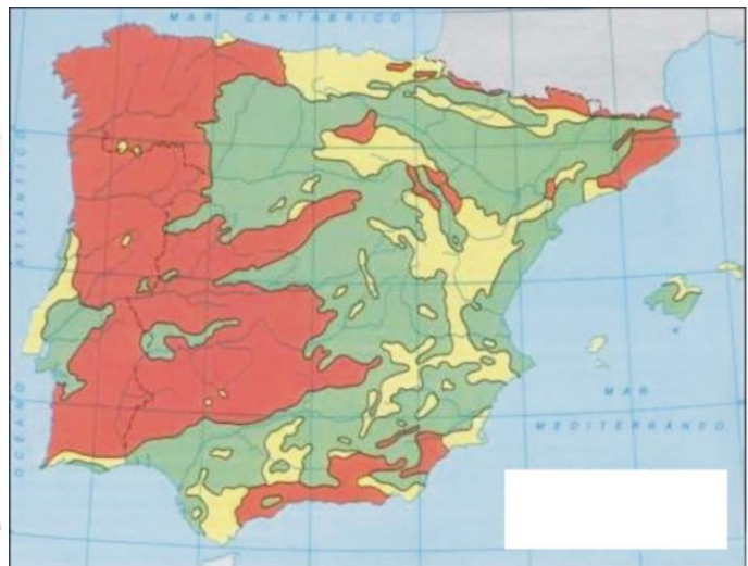
Figura 3. Editorial Vicens Vives.