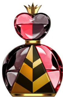
Queen of Hearts