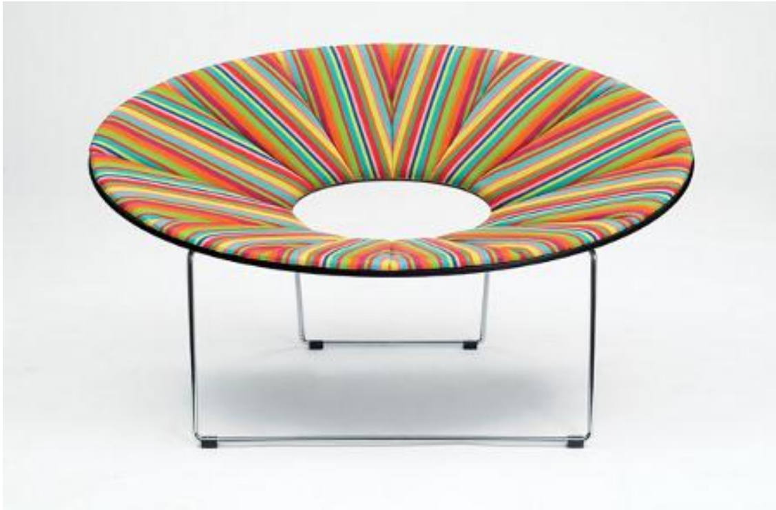
Deseño: Cadeira Elipse, Timo Ripatti