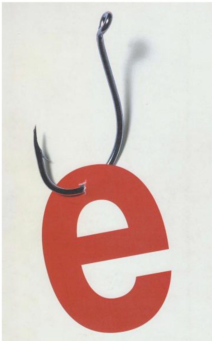
Diseño de portada de libro. Autor: Isidro Ferrer. Año: 2002

Corresponde á portada do catálogo da exposición: "Pasión Diseño español. Spanish design". Patrocinada por: "Ministerio de Economía" e a "Sociedad Estatal para la Acción Cultural Exterior".