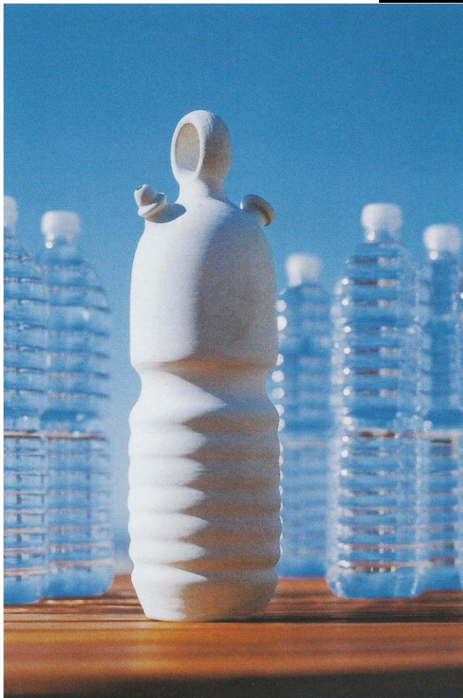
Diseño: Botijo La Siesta, de Héctor Serrano, Alberto Martínez y Raky Martínez. Ano: 1999.

Botijo inspirado en la forma de las botellas de agua mineral. Producida por La Mediterranea.