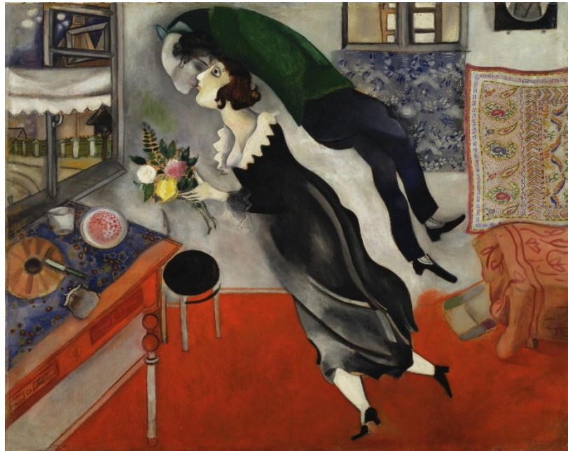
CHAGALL, Marc (1915): Birthday . Óleo sobre cartón, 80.6 x 99.7 cm. MoMA, Nova York.