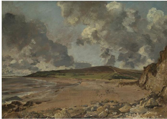
Constable, John (1816-17): " Weymouth Bay: Bowleaze Cove and Jordon Hill ". Óleo sobre tea, 53 x 75 cm. The National Gallery, Londres.