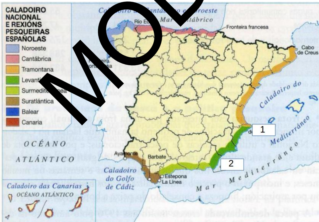
Figura 3 (Editorial Anaya)

Atendiendo a la figura 3: a) Identifique el tipo de documento y la información presentada (1 punto); b) Indique el nombre de 2 provincias de la región Surmediterránea y los cabos -numerados- que limitan la región levantina (1 punto); c) Explique las características de los caladeros nacionales (1,5 puntos); d) Indique las posibles alternativas a los problemas que presenta la pesca (1,5 puntos).