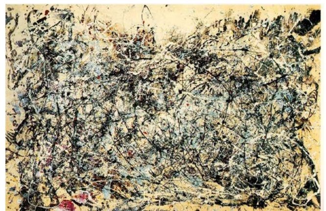
POLLOCK, Jackson, 1948: “Number 1A, 1948”. Óleo e esmalte sobre tea (172,7 x 264,2 cm), MoMa, Nova York.

PREGUNTA 4. Reflexione sobre “Weymouth Bay: Bowleaze Cove and Jordon Hill” de Constable, atendendo ao contido simbólico e á diferenza de percepción entre a época da obra proposta e a actualidade. Compare con outros autores/as, aínda que sexan doutras disciplinas artísticas / Reflexione sobre “Weymouth Bay: Bowleaze Cove and Jordon Hill” de Constable, atendiendo al contenido simbólico y a la diferencia de percepción entre la época de la obra propuesta y la actualidad. Compare con otros autores/as, aunque sean de otras disciplinas artísticas. (2,5 puntos)