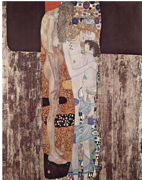
KLIMT, Gustav, 1905: “Die drei Lebensalter” (As tres idades da muller). Óleo sobre lea (180 x 180 cm.), Galería Nacional de Arte Moderno, Roma.

PREGUNTA 7. Reflexione sobre “Las tres edades” de Dalí, atendendo ao contido simbólico e á diferenza de percepción entre a época da obra proposta e a actualidade. Compare con outros autores/as, aínda que sexan doutras disciplinas artísticas / Reflexione sobre “Las tres edades” de Dalí, atendiendo al contenido simbólico y a la diferencia de percepción entre la época de la obra propuesta y la actualidad. Compare con otros autores/as, aunque sean de otras disciplinas artísticas. (2,5 puntos)