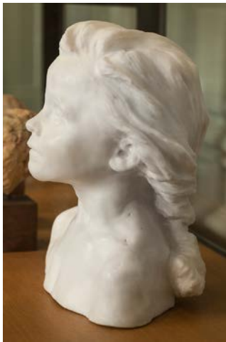
CLAUDEL, Camille, 1895: “ La petite Châtelaine ”. Mármol (34,6 x 28,4 x 22,7 cm.). Musée Rodin, París.

6.2 “ Recumbent Figure ” de Moore. (1,25 puntos)