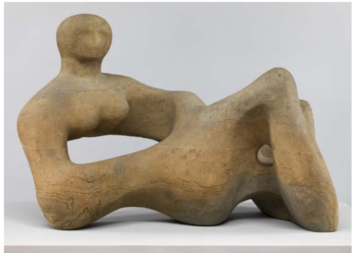
MOORE, Henry, 1938: “ Recumbent Figure ”. (88,9 x 132,7 x 73,7 cm.), pedra verde de Hornton, Tate Britain, Londres.

PREGUNTA 7. Reflexione sobre “ La petite Châtelaine ” de Claudel, atendendo ao contido simbólico e á diferenza de percepción entre a época da obra proposta e a actualidade. Compare con outros autores/as, aínda que sexan doutras disciplinas artísticas / Reflexione sobre “La petite Châtelaine” de Claudel, atendiendo al contenido simbólico y a la diferencia de percepción entre la época de la obra propuesta y la actualidad. Compare con otros autores/as, aunque sean de otras disciplinas artísticas. (2,5 puntos)