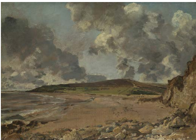
CONSTABLE, J., 1816-17: “Weymouth Bay: Bowleaze Cove and Jordon Hill”. Óleo sobre tea (53 x 75 cm), The National Gallery, Londres.