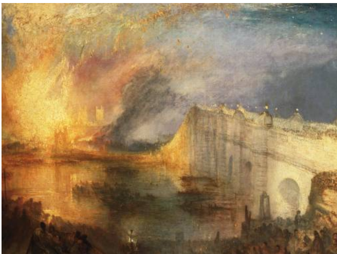
TURNER, Joseph Mallord William, 1834-1835: “ The Burning of the House of Lords and Commons, 16th October 1834 ”. Óleo sobre tea, (92,1 x 123,2 cm), Philadelphia Museum of Art.

3.2 “ Le Viaduc à L'Estaque ” de Braque. (1,25 puntos)