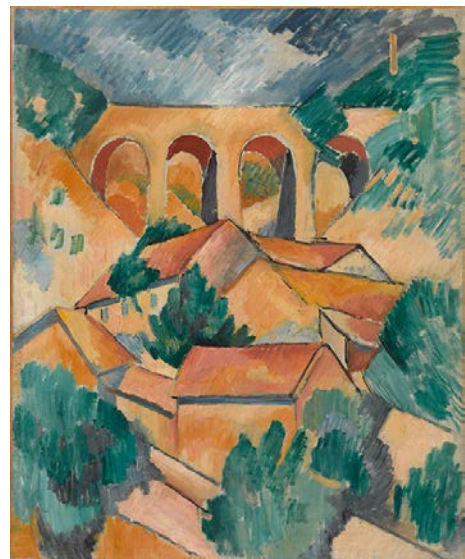
BRAQUE, Georges, 1908: “ Le Viaduc à L'Estaque ”. Óleo sobre tea (72,5 x 59 cm), Musée National d'Art Moderne, Centre Pompidou, París.

PREGUNTA 4. Reflexione sobre “ The Burning of the House of Lords and Commons, 16th October 1834 ” de Turner, atendendo ao contido simbólico e á diferenza de percepción entre a época da obra proposta e a actualidade. Compare con outros autores/as, aínda que sexan doutras disciplinas artísticas / Reflexione sobre “The Burning of the House of Lords and Commons, 16th October 1834” de Turner, atendiendo al contenido simbólico y a la diferencia de percepción entre la época de la obra propuesta y la actualidad. Compare con otros autores/as, aunque sean de otras disciplinas artísticas. (2,5 puntos)