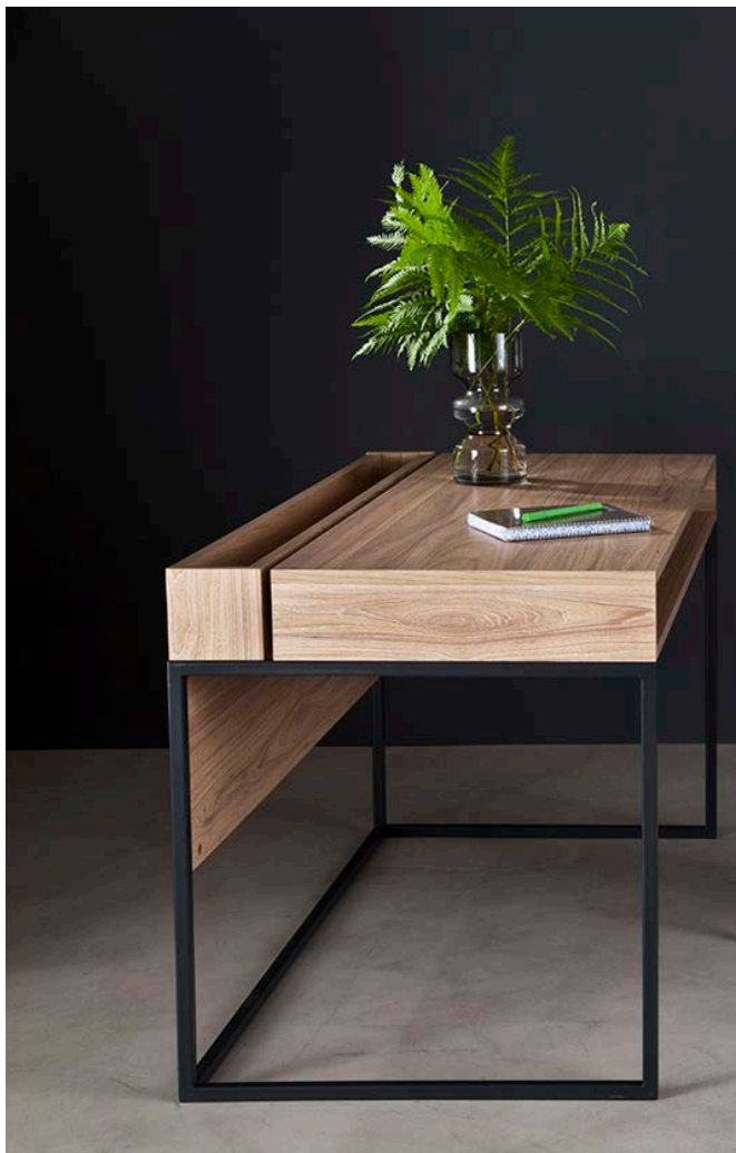
Mobiliario, mesa colección Autovía para Hauspack. Deseño de Federico Churba Finalista no apartado de Deseño industrial/produto da 5ª bienal Iberoamericana do deseño

2.2. Partindo da análise e comentario crítico anteriores, faga unha proposta de deseño dunha cadeira para a mesa, que formaría parte da mesma colección. / Partiendo del análisis y comentario crítico anteriores, haga una propuesta de diseño de una silla para la mesa, que formaría parte de la misma colección. (7 puntos: bosquejos/bocetos 2, proposta/propuesta final 3, presentación 2)