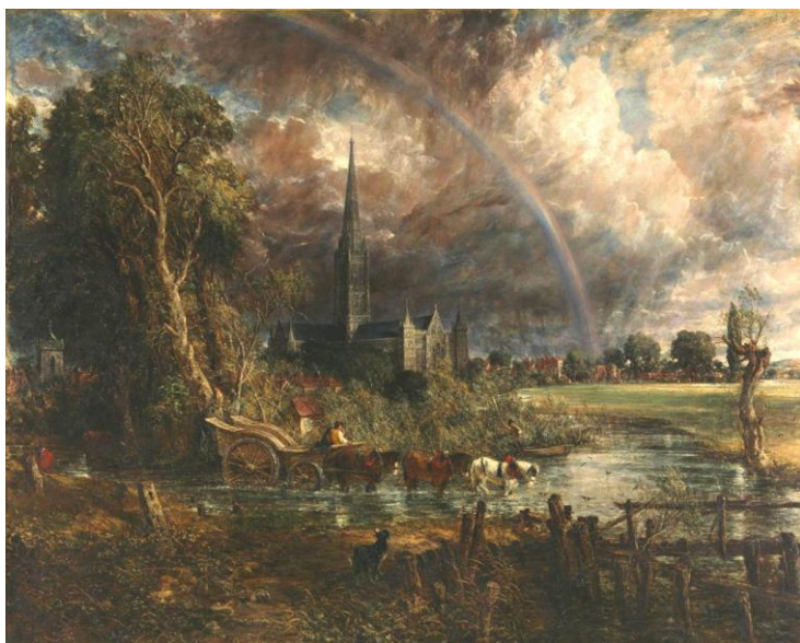
CONSTABLE, John, 1831: Salisbury Cathedral from the Meadows . Óleo sobre tea, (153,7x192cm) Tate Britain, .

PREGUNTA 4. Reflexión sobre Cathédrale de Rouen de MONET , atendendo: ao contido simbólico, á intencionalidade expresiva do artista e á diferenza de percepción entre a época da obra proposta e a actualidade (interpretación persoal coma espectador). / Reflexión sobre Cathédrale de Rouen de MONET, atendiendo: al contenido simbólico, a la intencionalidad expresiva del artista y a la diferencia de percepción entre la época de la obra propuesta y la actualidad (interpretación personal como espectador). (2,5 puntos)