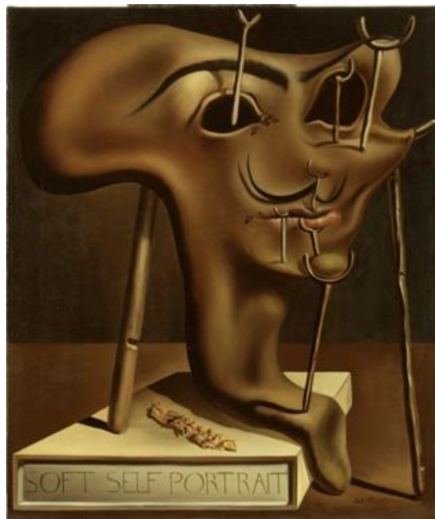
DALÍ, Salvador , 1941: Soft Self-Portrait with Grilled Bacon (Autorretrato brando con bacon frito). Óleo sobre tea (61x51 cm). Teatro-Museo Dalí, Figueres.