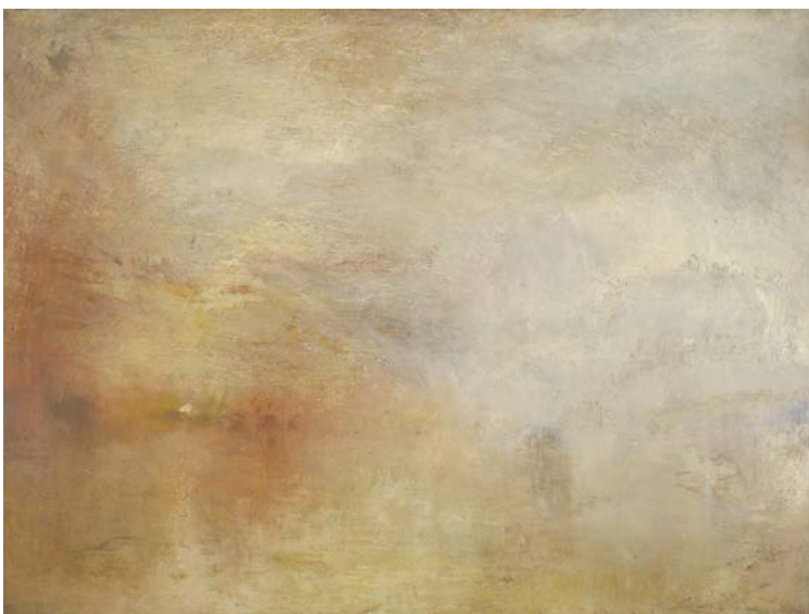
TURNER, J.M. William, 1840: Sun Setting over a Lake (O sol ponse sobre un lago). Óleo sobre tea, (91 x 122,5 cm). Tate Gallery, Londres.

PREGUNTA 4. Reflexión sobre Música del crepúsculo I de MIRÓ, atendendo: ao contido simbólico, á intencionalidade expresiva do artista e á diferenza de percepción entre a época da obra proposta e a actualidade (interpretación persoal como espectador). / Reflexión sobre Música del crepúsculo I de MIRÓ, atendiendo: al contenido simbólico, a la intencionalidad expresiva del artista y a la diferencia de percepción entre la época de la obra propuesta y la actualidad (interpretación personal como espectador). (2,5 puntos)