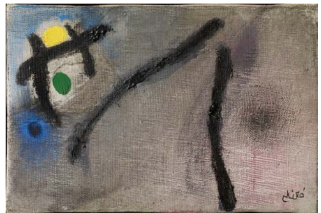
MIRÓ, Joan, 1965: Música del crepúsculo I . Óleo sobre tea (16x24 cm). Fundació Joan Miró, Barcelona.