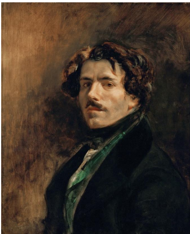
DELACROIX, EUGÈNE , 1837: Autoportrait au gilet vert (Autorretrato con chaleco verde). Óleo sobre tea (65x54 cm). Musée du Louvre, París.

PREGUNTA 8. Reflexión sobre Soft Self-Portrait with Grilled Bacon de DALÍ, atendendo: ao contido simbólico, á intencionalidade expresiva do artista e á diferenza de percepción entre a época da obra proposta e a actualidade (interpretación persoal como espectador). / Reflexión sobre Soft Self-Portrait with Grilled Bacon de DALÍ, atendiendo: al contenido simbólico, a la intencionalidad expresiva del artista y a la diferencia de percepción entre la época de la obra propuesta y la actualidad (interpretación personal como espectador). (2,5 puntos)