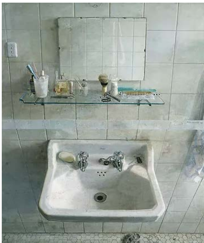
LÓPEZ, Antonio, 1967: Lavabo y espejo . Óleo sobre táboa, (96,5x83,8cm), Museum of Fine Arts, Boston.

PREGUNTA 8. Reflexión sobre El lavabo de GRIS, atendendo: ao contido simbólico, á intencionalidade expresiva do artista e á diferenza de percepción entre a época da obra proposta e a actualidade (interpretación persoal como espectador). / Reflexión sobre El lavabo de GRIS, atendiendo: al contenido simbólico, a la intencionalidad expresiva del artista y a la diferencia de percepción entre la época de la obra propuesta y la actualidad (interpretación personal como espectador). (2,5 puntos)