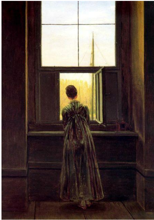
FRIEDRICH, Caspar David, 1822: "Frau am Fenster" (Muller na fiestra). Óleo sobre lenzo (44,1 x 37 cm), Nationalgalerie der Staatliche Museen zu Berlin.

O exame consta de 8 preguntas de 2,5 puntos, das que poderá responder un MÁXIMO DE 4 , combinadas como queira. Se responde máis preguntas das permitidas, só se corruxarán as 4 primeiras respondidas. / El examen consta de 8 preguntas de 2,5 puntos, de las que podrá responder un MÁXIMO DE 4 , combinadas como queira. Si responde a más preguntas de las permitidas, solo se corruxarán las 4 primeras respondidas.