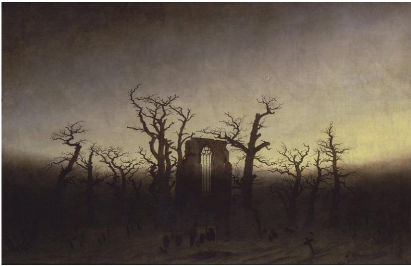
FRIEDRICH, Caspar D., 1809/10: "Abtei im Eichwald" (Abadía no enciñar). Óleo sobre lenzo (110,4 x 171 cm.), Staatliche Museen zu Berlin.