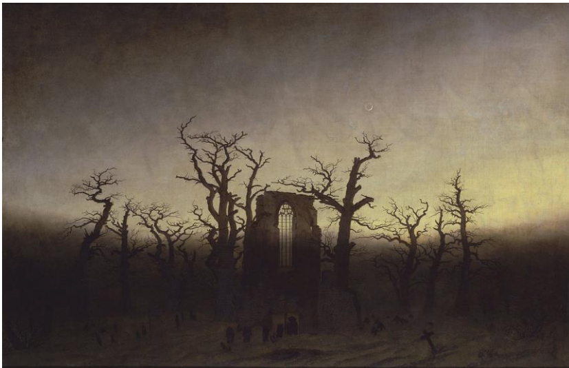
FRIEDRICH, Caspar D., 1809/10: "Abtei im Eichwald" (Abadía no enciñar). Óleo sobre lenzo (110,4 x 171 cm.), Staatliche Museen zu Berlin.