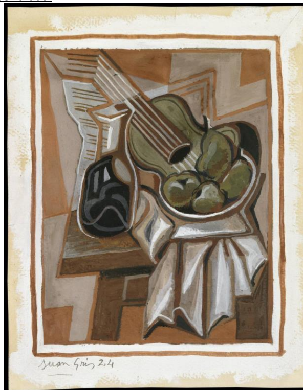
GRIS, Juan, 1924: "Nature morte à la guitare" (Bodegón á guitarra). Gouache sobre papel (197x155 cm.), Tate Britain, Londres.

PREGUNTA 1. Paul CÉZANNE e Juan GRIS/ Paul CÉZANNE y Juan GRIS.