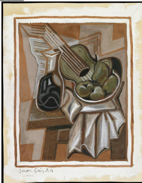
GRIS, Juan, 1924: "Nature morte à la guitare" (Bodegón á guitarra). Gouache sobre papel (197x155 cm.), Tate Britain, Londres.

PREGUNTA 1. Paul CÉZANNE e Juan GRIS/ Paul CÉZANNE y Juan GRIS.