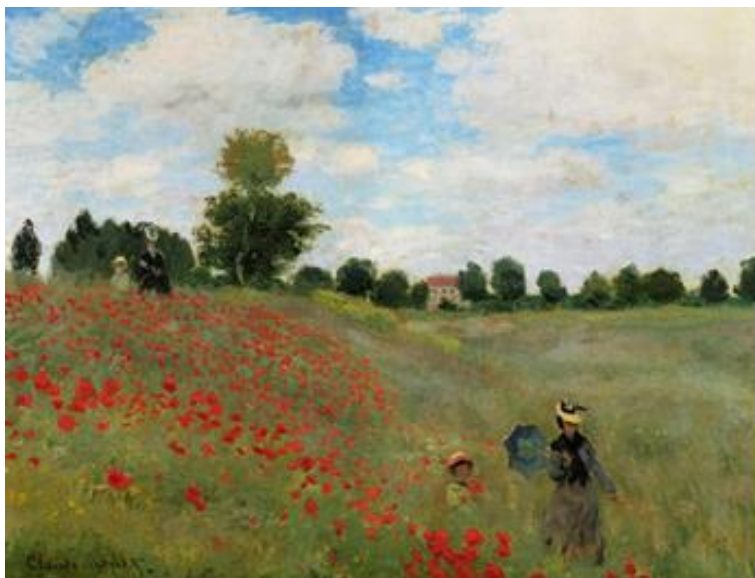
MONET, Claude, 1840-1926: "Papoulas". Óleo sobre lenzo (50 x 65 cm.), Musée d'Orsay, París.