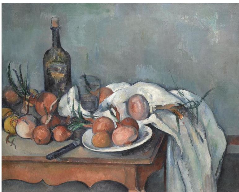
CÉZANNE, Paul, 1896-98: "Nature morte aux aignons" (Bodegón con cebolas). Óleo sobre lenzo (66x82 cm.), Musée d'Orsay, París.

O exame consta de 8 preguntas de 2,5 puntos, das que poderá responder un MÁXIMO DE 4 , combinadas como queira. Se responde máis preguntas das permitidas, só se corruxirán as 4 primeiras respondidas. / El examen consta de 8 preguntas de 2,5 puntos, de las que podrá responder un MÁXIMO DE 4, combinadas como quiera. Si responde a más preguntas de las permitidas, solo se corregirán las 4 primeras respondidas.