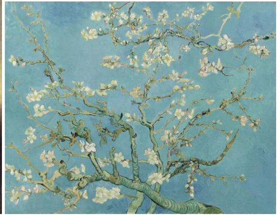
VAN GOGH, Vincent, 1890: "Almond Blossom" (Flor de améndoa). Óleo sobre lenzo (73.3x 37 cm.), Van Gogh Museum, Amsterdam.