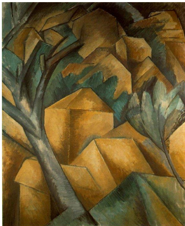
BRAQUE, Georges, 1908: "Paisatge de L'Estaque" (Paisaxe de L'Estaque). Óleo sobre lenzo (73 x 60 cm), Kunstmuseum Bern, Suíza.