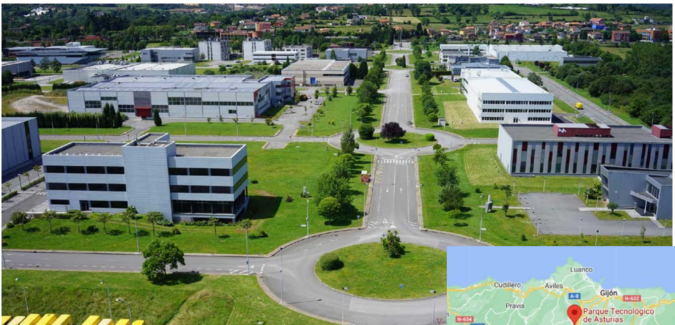
Figura 1: Parque Tecnológico de Asturias - Llanera (Asturias)

PREGUNTA 3. Análise de documento gráfico / Análisis de documento gráfico: