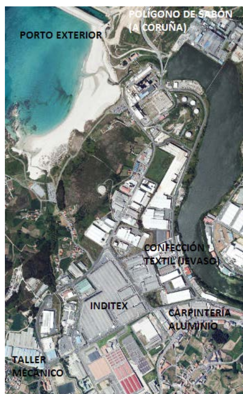
Figura 1.-Polígono Industrial de Sabón. Elaboración propia

Atendiendo a las figuras 1 y 2: a) Enumere las cuatro provincias con el porcentaje de producto interior bruto industrial superior al 25 %. (1 punto) ; b) Identifique los tipos de documento representados en las figuras 1 y 2 y describa los elementos que componen la figura 1. (1 punto) ; c) Explique los factores de localización de dos industrias del polígono de Sabón (1,5 puntos) ; d) Exponga razonadamente los problemas de este espacio