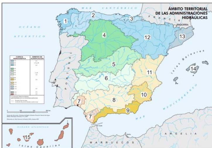
Figura 3.

Atendiendo a la figura 3: a) Relacione los siguientes ríos con el número de su administración hidráulica según el mapa de la figura 3: Bidasoa, Guadiana, Tiétar, Llobregat, Nalón, Esla, Segura, Segre, Turia, Ulla. (1 punto) ; b) Analice el tipo de documento de la figura 4 y explique cómo se obtiene el valor “k” y el valor “Mr”. (1 punto) ; c) Identifique y justifique el tipo de régimen fluvial representado en la figura 4, así como las principales características de los ríos de su vertiente hidrográfica. (1,5 puntos) ; d) Cite y explique brevemente los principales factores físicos y humanos que tienen influencia en la distribución de aguas y en los recursos hídricos del territorio español. (1,5 puntos) .