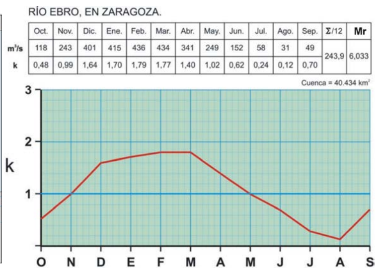
Figura 4.-Fonte: España a través de los mapas (IGN)