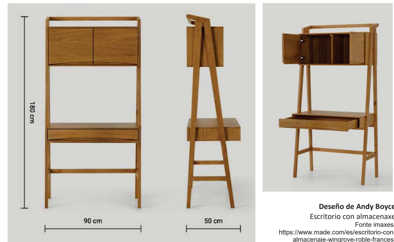
Deseño de Andy Boyce

1.2. Partindo da análise e comentario crítico anteriores, faga unha proposta de deseño dunha cadeira para o escritorio, que formaría parte da mesma colección. / Partiendo del análisis y comentario crítico anteriores, haga una propuesta de diseño de una silla para el escritorio, que formaría parte de la misma colección. (7 puntos: bosquejos/bocetos 2, proposta/propuesta final 3, presentación 2)