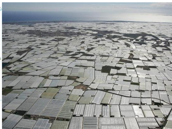
Figura 2.