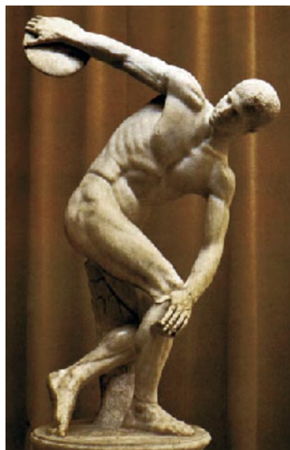
Lámina 2 (hasta 4 puntos) / Lámina 2 (ata 4 puntos)

Realiza un estudio formal de la obra incidiendo en su concepción espacial (hasta 2 puntos). / Realiza un estudio formal da obra incidindo na súa concepción espacial (ata 2 puntos).