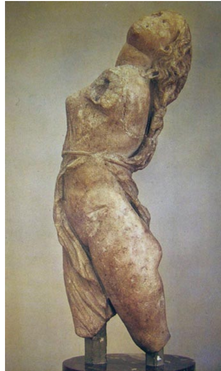
Lámina 2 (hasta 4 puntos). / Lámina 2 (ata 4 puntos).

Realiza un estudio iconográfico y formal de la obra incidiendo en su concepción espacial (hasta 2 puntos). / Realiza un estudio iconográfico e formal da obra incidindo na súa concepción espacial (ata 2 puntos).