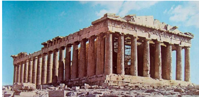
Lámina 2 (hasta 4 puntos) / Lámina 2 (ata 4 puntos)

Señala sus características formales y espaciales (hasta 1 punto) / Sinala a suas características formais e espaciais (ata 1 punto).