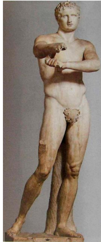
Lámina 2 (hasta 4 puntos). / Lámina 2 (ata 4 puntos).

Realiza un estudio formal de la obra incidiendo en su concepción espacial (hasta 1 punto) / Realiza un estudio formal da obra incidindo na súa concepción espacial (ata 1 punto).