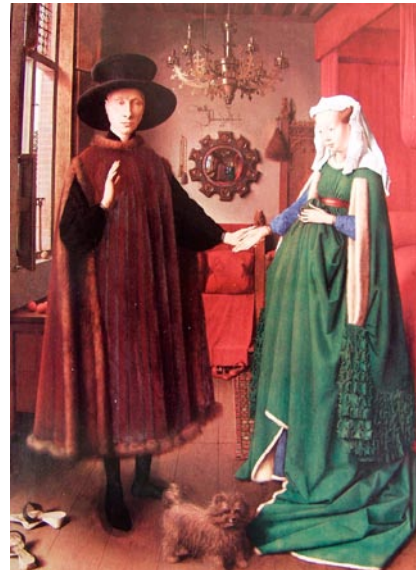
Lámina 2 (hasta 4 puntos). / Lámina 2 (ata 4 puntos).

Estudia esta obra iconográfica y formalmente (hasta 2 puntos) / Estudia esta obra iconográfica e formalmente (ata 2 puntos).