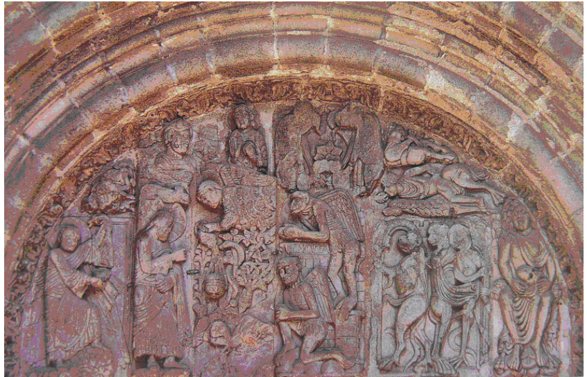
Lámina 2 (hasta 4 puntos). / Lámina 2 (ata 4 puntos).

Estudia esta obra iconográfica y formalmente (hasta 2 puntos). / Estudia esta obra iconográfica e formalmente (ata 2 puntos)