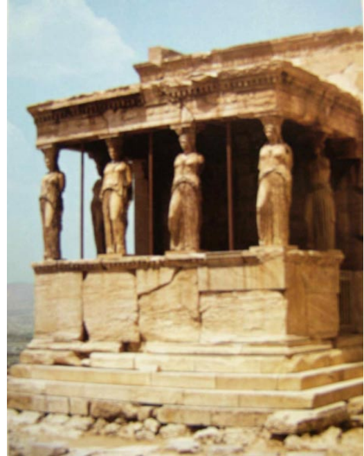
Lámina 2 (hasta 4 puntos). / Lámina 2 (ata 4 puntos).

Señala sus características formales y espaciales (hasta 1 punto). / Sinala as suas características formais e espaciais (ata 1 punto).