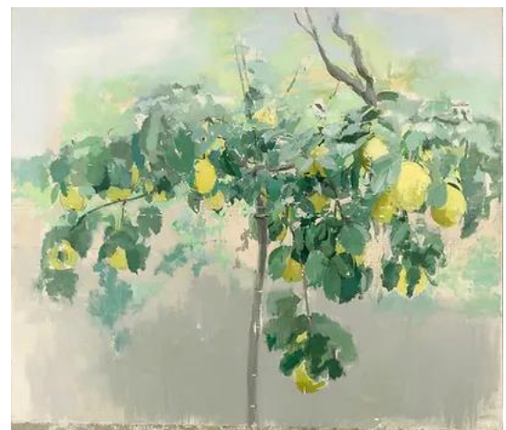
LÓPEZ, Antonio, 1990: Membrillero . Óleo sobre tea (105x119 cm). Fundación Focus-Abengoa, Sevilla.