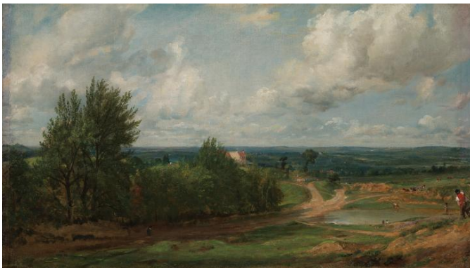
CONSTABLE, John, 1819-20: Hampstead Heath, with the House Called "The Salt Box" . Óleo sobre tea (38,4x67cm). Tate Gallery, Londres

PREGUNTA 4. Reflexión sobre Korenveld met kraaine de VAN GOGH, atendendo: ao contido simbólico, á intencionalidade expresiva do artista e á diferenza de percepción entre a época da obra proposta e a actualidade (interpretación persoal como espectador). / Reflexión sobre Korenveld met kraaine de VAN GOGH , atendiendo: al contenido simbólico, a la intencionalidad expresiva del artista y a la diferencia de percepción entre la época de la obra propuesta y la actualidad (interpretación personal como espectador). (2,5 puntos)