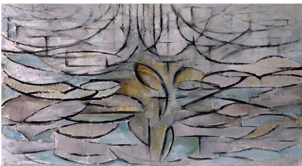
MONDRIAN, Piet, 1912: Manzano en flor . Óleo sobre tea, (107,5 x 78,5 cm). Kunstmuseum den Haag, La Haya.

PREGUNTA 4. Reflexión sobre Marmeleiro de LÓPEZ, atendendo: ao contido simbólico, á intencionalidade expresiva do artista e á diferenza de percepción entre a época da obra proposta e a actualidade (interpretación persoal coma espectador). / Membrillero de LÓPEZ, atendendo: al contenido simbólico, a la intencionalidad expresiva del artista y a la diferencia de percepción entre la época de la obra propuesta y la actualidad (interpretación personal como espectador). (2,5 puntos)