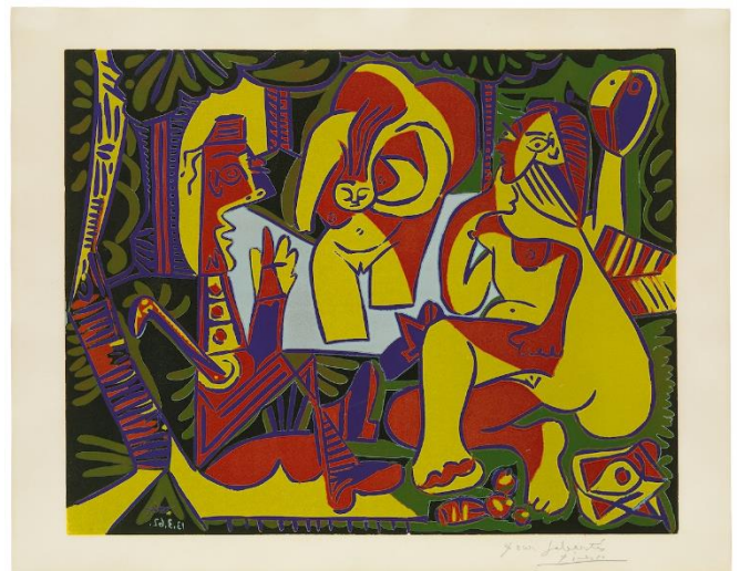
PICASSO, Pablo, 1962: Variación de "Le Déjeuner sur l'Herbe" de Manet I . Estampación sobre papel (53,1 x 64 cm.; 61,7 x 75,1 cm.). Museu Picasso, Barcelona.