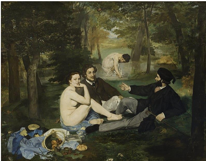
MANET, Édouard, 1863: Le Déjeuner sur l'Herbe . Óleo sobre tea, (208x264,5cm), Musée d'Orsay, París.

PREGUNTA 8. Reflexión sobre Variación de "Le Déjeuner sur l'Herbe" de Manet I de PICASSO, atendendo: ao contido simbólico, á intencionalidade expresiva do artista e á diferenza de percepción entre a época da obra proposta e a actualidade (interpretación persoal coma espectador). / Reflexión sobre Variación de "Le Déjeuner sur l'Herbe" de Manet I de PICASSO, atendiendo: al contenido simbólico, a la intencionalidad expresiva del artista y a la diferencia de percepción entre la época de la obra propuesta y la actualidad (interpretación personal como espectador). (2,5 puntos)