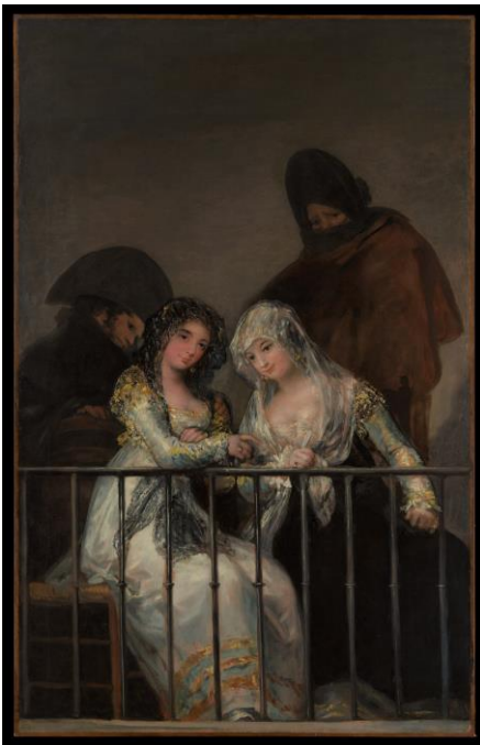
GOYA, Francisco de, 1808-1814: Majas al balcón . Óleo sobre tea (194,9x125,7 cm). The Metropolitan Museum of Art, New York .

PREGUNTA 8. Reflexión sobre Le Balcon de MANET, atendendo: ao contido simbólico, á intencionalidade expresiva do artista e á diferenza de percepción entre a época da obra proposta e a actualidade (interpretación persoal como espectador). / Reflexión sobre Le Balcon de MANET, atendiendo: al contenido simbólico, a la intencionalidad expresiva del artista y a la diferencia de percepción entre la época de la obra propuesta y la actualidad (interpretación personal como espectador). (2,5 puntos)