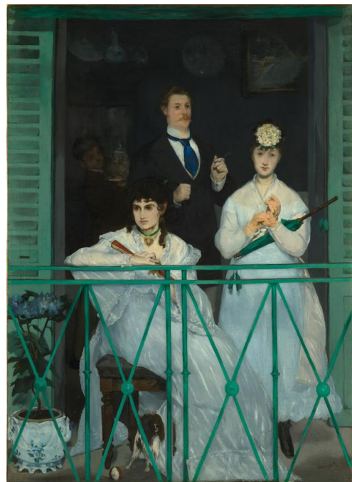
MANET, Edouard, 1868: Le Balcon . Óleo sobre tea (170x124,5 cm). Musée d'Orsay, París.